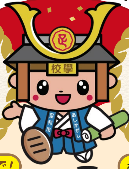
足利市イメージキャラクター たかうじ君